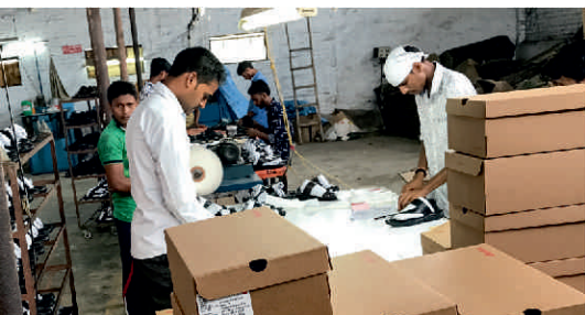
Dělníci v továrně v indické Agře